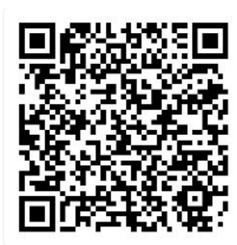
扫码提交选拔回执

(三) 请参赛队务必于 7 月 23 日前登录平台 ( https://c5yun.chinajxedu.com ) 或微信扫描下方二维码提交选拔回执信息，逾期未提交视为自动放弃参赛资格。