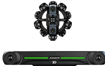
（ZCSCAN-TR70 无线跟踪式三维扫描仪图片）