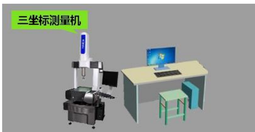
图 3 三坐标测量机技术平台示意图