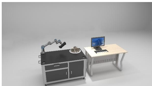
图 1 教师组技术平台示意图