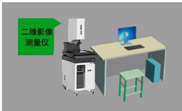
图 4 二维影像测量仪技术平台示意图