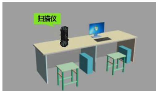
图 2 学生组技术平台示意图