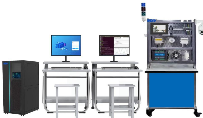
图 人工智能综合应用实训平台产品效果图

本次大赛的竞赛平台采用 AITE-S2 型人工智能综合应用实训平台。本次大赛的竞赛平台配置清单、参数如下：