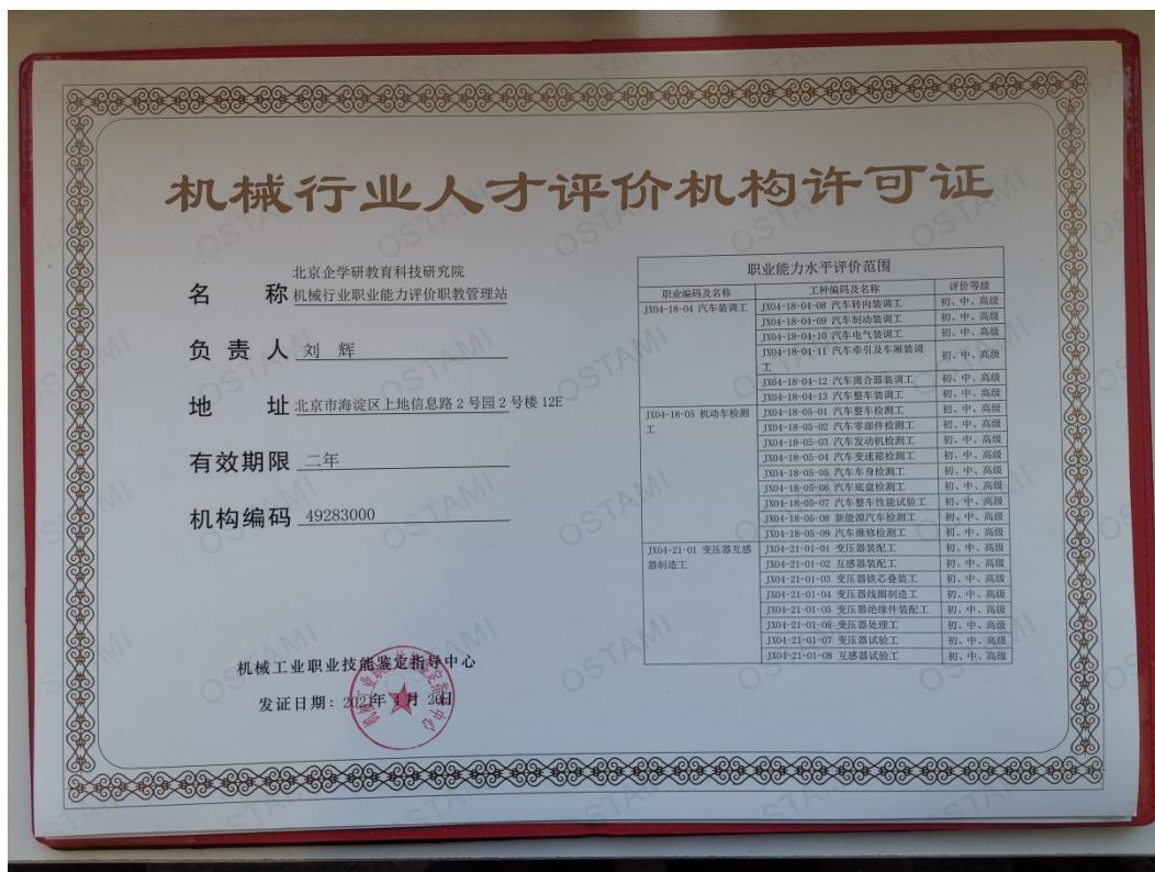
机械行业人才评价机构许可证