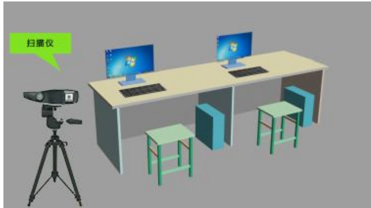
图3 学生组技术平台示意图