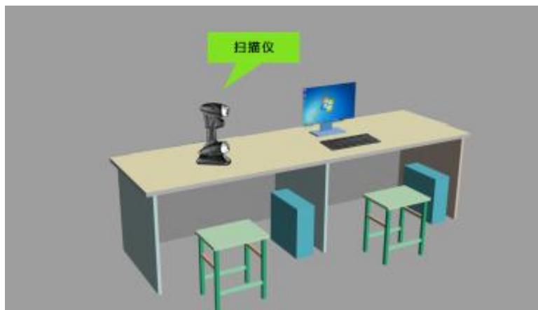
图4 教师组、职工组技术平台示意图