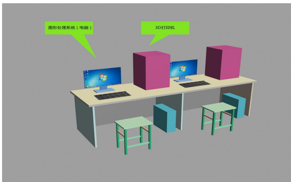
图6 技术平台示意图