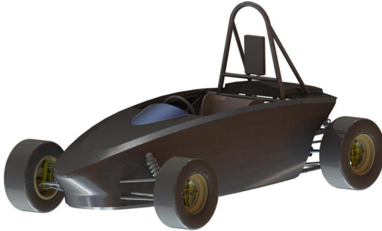
图 1 赛事技术平台示意图

本赛事采用的技术平台示意图见图 1。所有设计和制作应以此为基础。由大赛合作企业有偿提供可以运行指定配置的车辆及各种备选部件。选手赛前制作连接件、车身及底盘覆盖件等，将所有部件合理组装成一辆高性能并符合技术细则的小型新能源赛车，来完成相关比赛项目。