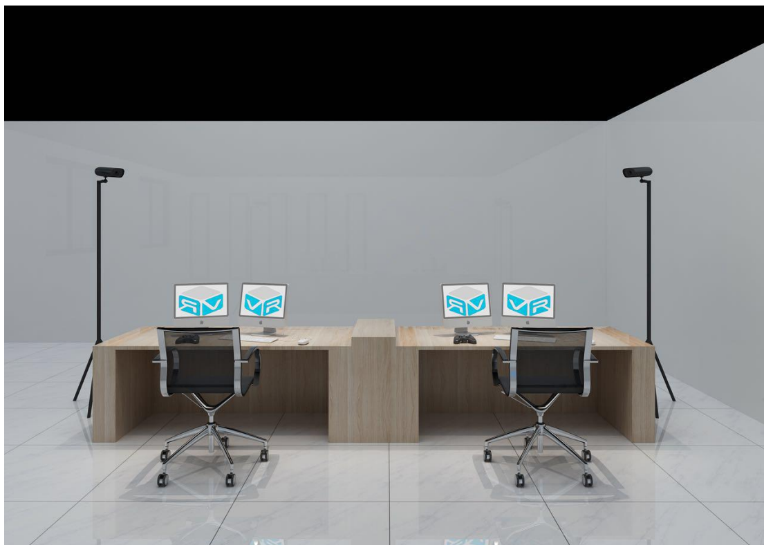
图三 竞赛工位效果图